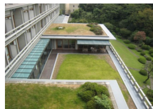
国際文化会館（東京六本木）

薩摩藩独自の自治制度により藩内に100余り存在した麓集落。鹿児島に残る麓集落の景観は、大切な地域資産ですが、道路拡幅や区画整理、敷地分割、改築等により危機的な状況にあります。現在の麓集落の状況調査とこの景観をいかに継承して、まちを活性化できるかについて研究を進めています。