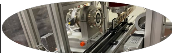
図1 Feガンマ線メスバウア分光装置 (アイソトープ実験施設設置)