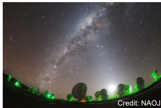
▲標高5000m超の砂漠に位置する巨大施設ALMA