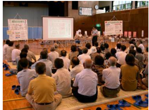
住民健診を受診した35~69歳の住民に協力により調査を実施

研究対象者は、あまみ5島の1市9町の住民健診を受診した住民の方で、平成17~20年の4年間で5,344名の方々に研究に参加して頂きました。調査は市町村と健診機関のご協力を頂き、研究への同意を頂いた方から、健診時の生活習慣調査、遺伝子を含む採血と採尿、動脈硬化測定を行い、健診結果を提供して頂きました。その後、5年後に同じ調査をするとともに、毎年、罹った病気の調査や転出、死亡の追跡調査（20年間）を行います。これらの調査で得られたデータをもとに、生活習慣病に罹った人と健康な人の生活習慣や遺伝子を用いた体質を解析して、その予防に有効な知見を調べます。