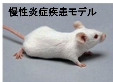
慢性炎症疾患モデル