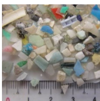
マイクロプラスチック