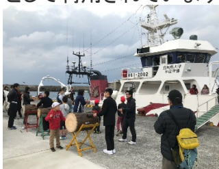
三島村における地球（ジオ）科教育「Enjoy竹島with鹿大留学生」