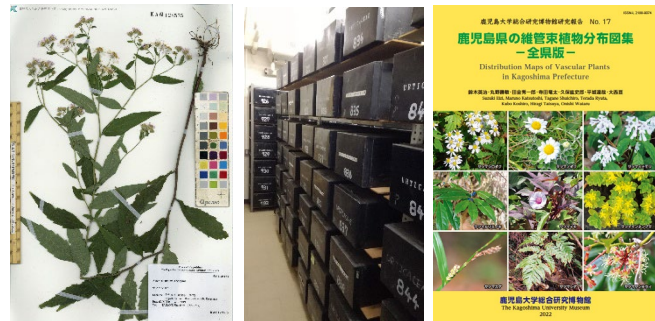
図. 植物標本(左)、植物標本室(中)、鹿児島県の維管束植物分布図集(右)

総合研究博物館は100年以上前から、県内をはじめ、世界各地から収集された植物標本約18万点を所蔵しています。現在は、鹿児島の植物相の解明に向けて自ら野外調査を進める一方で、これらの植物標本のデータベース化を推進し、地域の植物相の理解や過去との比較に重要な基礎的知見の整備・提供に取り組んでいます。2022年には鹿児島の植物に関する最新の知見を集約した「鹿児島県の維管束植物分布図集」を出版しました。