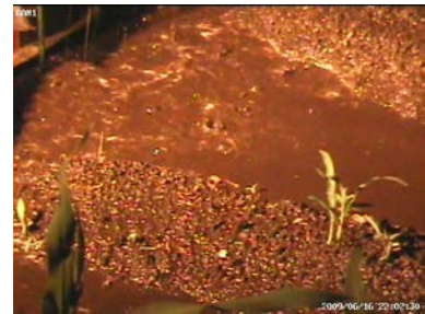
図1 傾斜畑における表面流

傾斜畑の表面流の自動計測システムを開発中。土壌流出による環境汚染対策に活用できる技術です。鹿児島県の公的機関等との共同研究が可能。撮影画像からの計測方法を開発できる画像処理技術を持つ提携先も求めています。