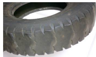
多角形化したタイヤ