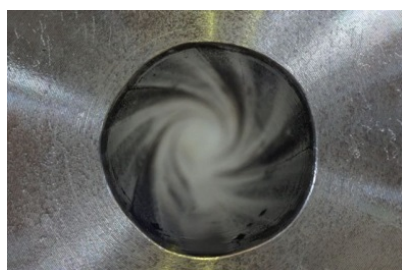
ライフリングマーク【1】